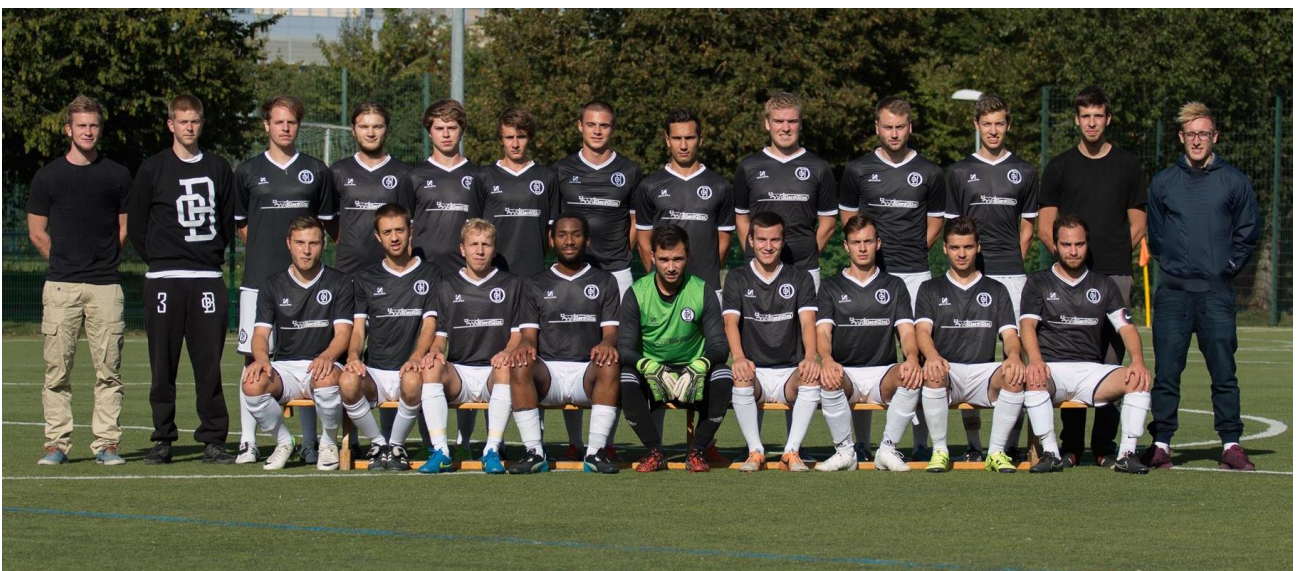
Die erste Mannschaft des Ostbärn F.C. in der Saison 2015/2016.

Social Media: Ostbärn F.C. (Facebook), @ostbaernfc (Twitter)